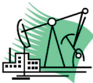
HAUSSE DU PRIX DU PÉTROLE