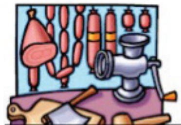
CHANGEMENTS D'HABITUDES ALIMENTAIRES DANS LES PAYS ÉMERGENTS